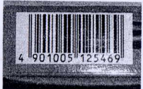
バーコードは切って保存

バーコードを集めている商品 リプトン紅茶各種、日東紅茶、キ ーコーヒーVP各種、UCCコーヒー 各種、MMCコーヒー各種、ニッス イ練り製品・冷凍食品、味の素マヨ ネーズ各種、味の素HOT!!各種 クノールカップスープ他、ポッカじ ゃくりコト煮込んだスープ他、丸 大食品ソーセージ各種、永谷園お 茶漬け・ふりかけ各種、日本レバ ーマソフト各種、カゴメケチャッ プ、ダイショー味塩こしょう・焼肉の たれ、キュービーマヨネーズ各種 エースコックススーパーカップ、日清 チキンラーメン・UFO・チャルメ ラ、日清食品どん兵衛、明治十勝 チーズシリーズ全品、明治カー ル・チョコレート各種、グリコポッ キー・チョコレート各種、グリコア イス各種ほか